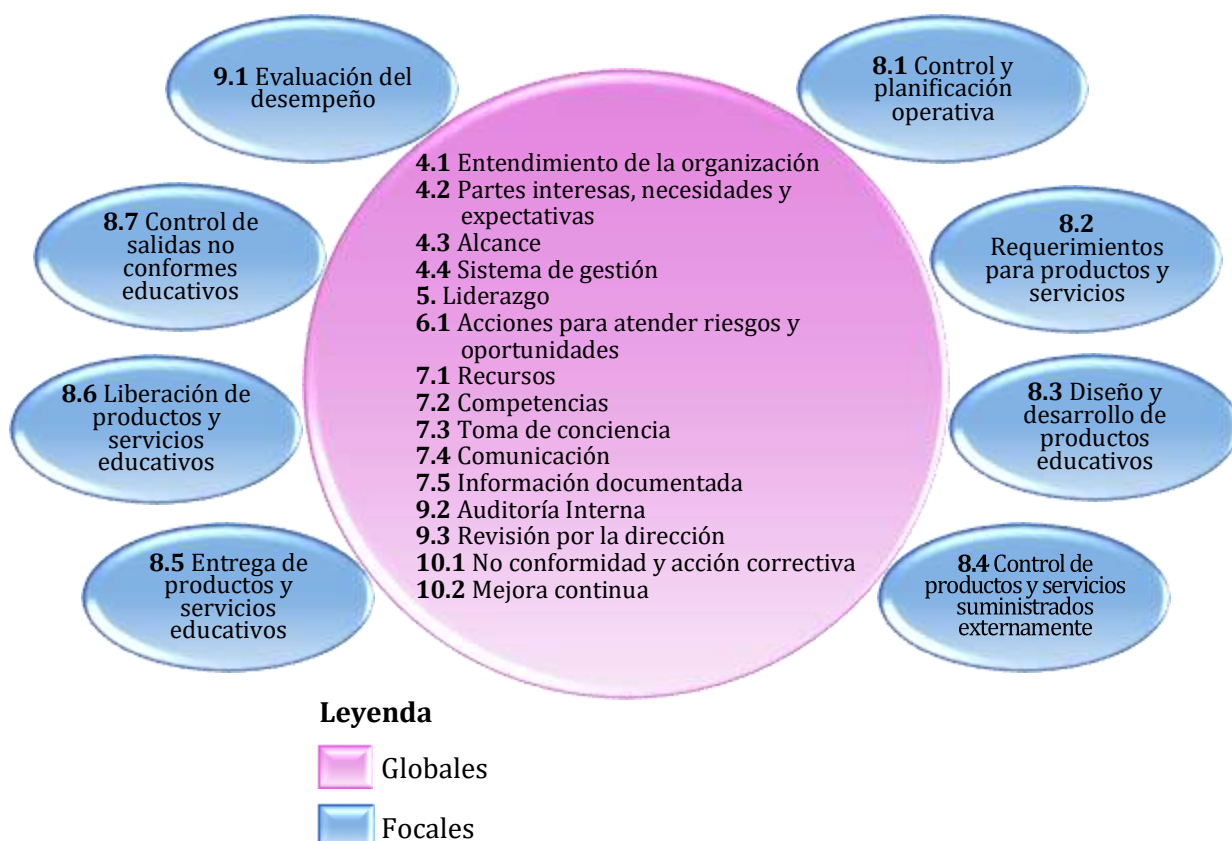
Figura N°2: Clasificación de los Requerimientos del ISO 21001:2018 en Globales y Focales

Una pregunta que siempre se presenta cuando se inicia la documentación de estándares en un proyecto de implantación, es: ¿por dónde se inicia la documentación? Si esta inquietud no está claramente definida, el proyecto de documentación del estándar, podría convertirse en un viaje a lo desconocido.